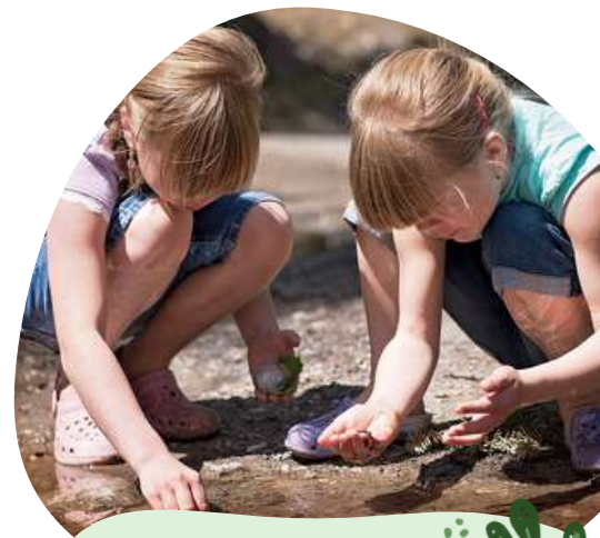
OCCE Belfort Office Central de la Coopération à l'école

L'OCCE de Belfort et la Maison Départementale de l'Environnement ont favorisé l'émergence de l'école dehors en accompagnant des enseignants en demande d'espaces d'échanges et de pratiques. Rejoints par des associations nature du territoire et de plus en plus d'enseignants, ils constituent depuis 2020 un collectif qui facilite l'accès des enfants à des expériences de nature, en impliquant les familles. La dynamique en place, fortement soutenue par l'Inspection académique, repose sur des rencontres, intégrées dans le parcours de formation de l'Education Nationale. Le soutien de l'appel à communs va permettre la montée en compétences du collectif et la structuration du réseau animée jusqu'ici de façon bénévole.