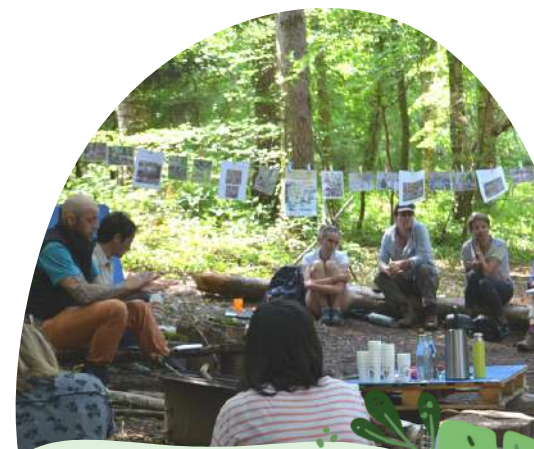
Réseau d'Education à l'Environnement Auvergne

Alors que l'école du dehors se diffuse en Auvergne, mais connaît de fortes disparités selon les lieux, le REEA et 8 de ses adhérents souhaitent développer la pratique de l'école du dehors dans les 4 départements auvergnats : Allier, Cantal, Haute-Loire et Puy de Dôme. Le projet prévoit la réalisation d'un état des lieux des pratiques d'école du dehors, l'animation de 15 temps d'échanges pour les animateurs, enseignants, ATSEM, conseillers pédagogiques, inspecteur d'académie, parents..., l'organisation d'un colloque final régional, et la réalisation et la diffusion d'un document de synthèse afin d'essaimer l'école du dehors dans les territoires.